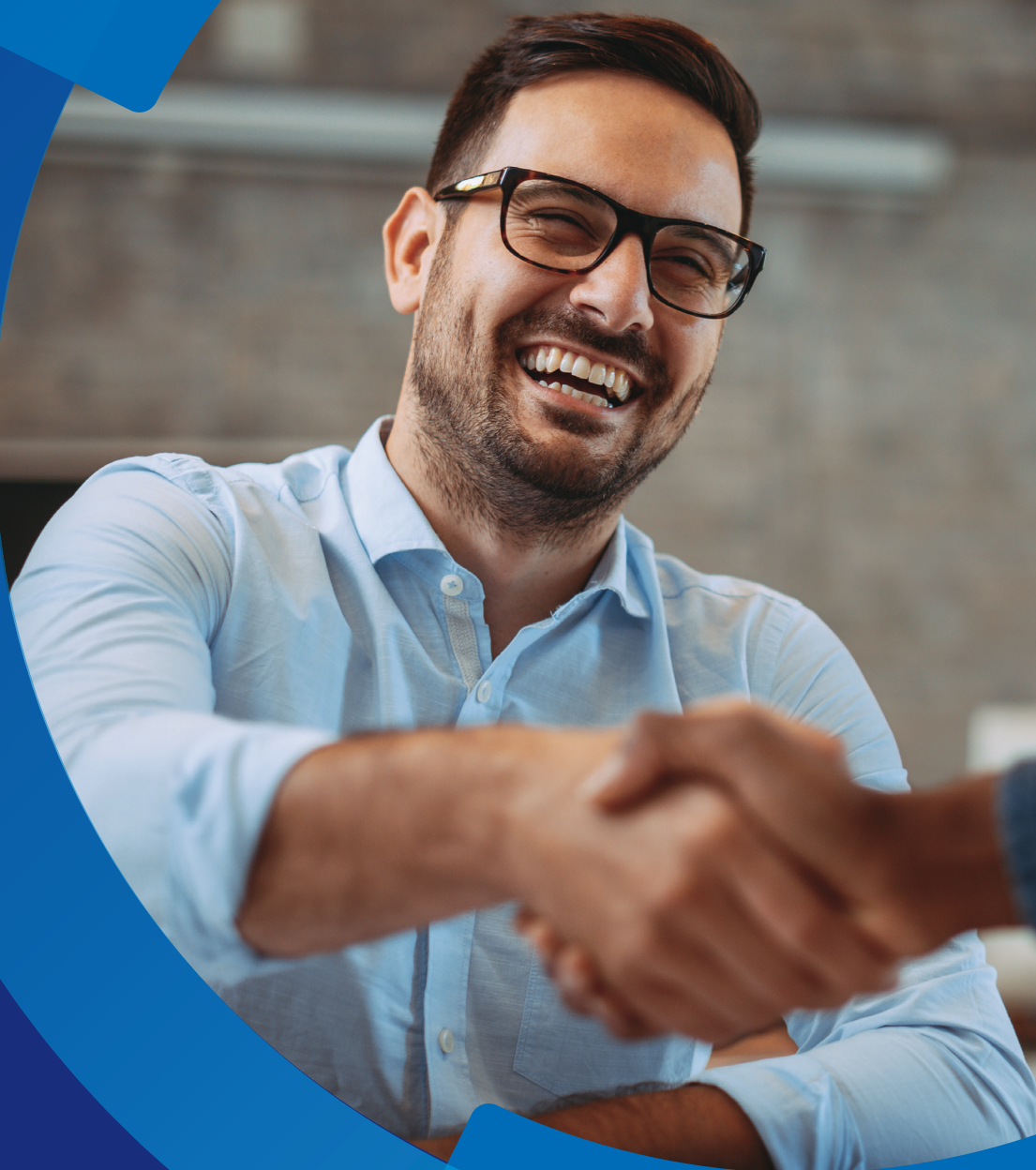
Tabela de Preços Bahia

Válida a partir de 15 de outubro de 2019